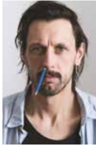
Stefan Ebner Regie & Text

Tagein tagaus wählt man zwischen mag ich, mag ich nicht, gefällt mir, gefällt mir nicht.